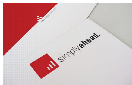
Kunde: simply ahead. Projekt: Corporate Design Entwicklung zum Launch des Unternehmens. ☑ mehr dazu...