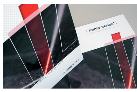
Kunde: InnoLas Laser GmbH Projekt: Gestaltung und Umsetzung eines Folders nebst Datenblätter zum Launch der neuen Laser-Produktserie. ☑ mehr dazu...

Haben Sie Fragen, Anregungen oder ein konkretes Projekt? Dann rufen Sie uns an oder senden Sie einfach eine E-Mail an info@ruffstone.de