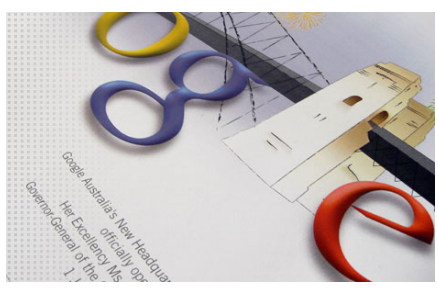
Kunde: Google Australia Inc. Projekt: Entwicklung eines Logos für den Office Opening Event in Sydney. ☑ mehr dazu...