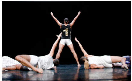
Kunde: Symantec GmbH | Premiere „The ONE Solution“ Projekt: Konzeption, Idee und Umsetzung des Launches der ONE Solution als „Premierenfeier“. ☑ mehr dazu...