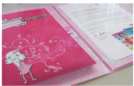
Kunde: Axel Springer Verlag | Mädchen Projekt: Entwicklung eines Imageflyers mit Gewinnspiel für das Magazin Mädchen. ☑ mehr dazu...

Wir freuen uns darauf, Sie kennen zu lernen.