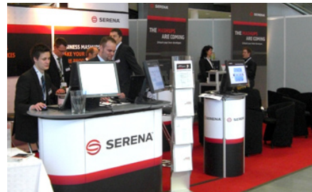
Kunde: Serena Software GmbH | OOP 2009 Projekt: Eventkonzept in Kombination mit „below-the-line“-Kommunikationsmaßnahmen und klassischer Ausstellungs-gestaltung. ☑ mehr dazu...

Ruffstone GmbH Adlzreiterstr. 29 80337 München